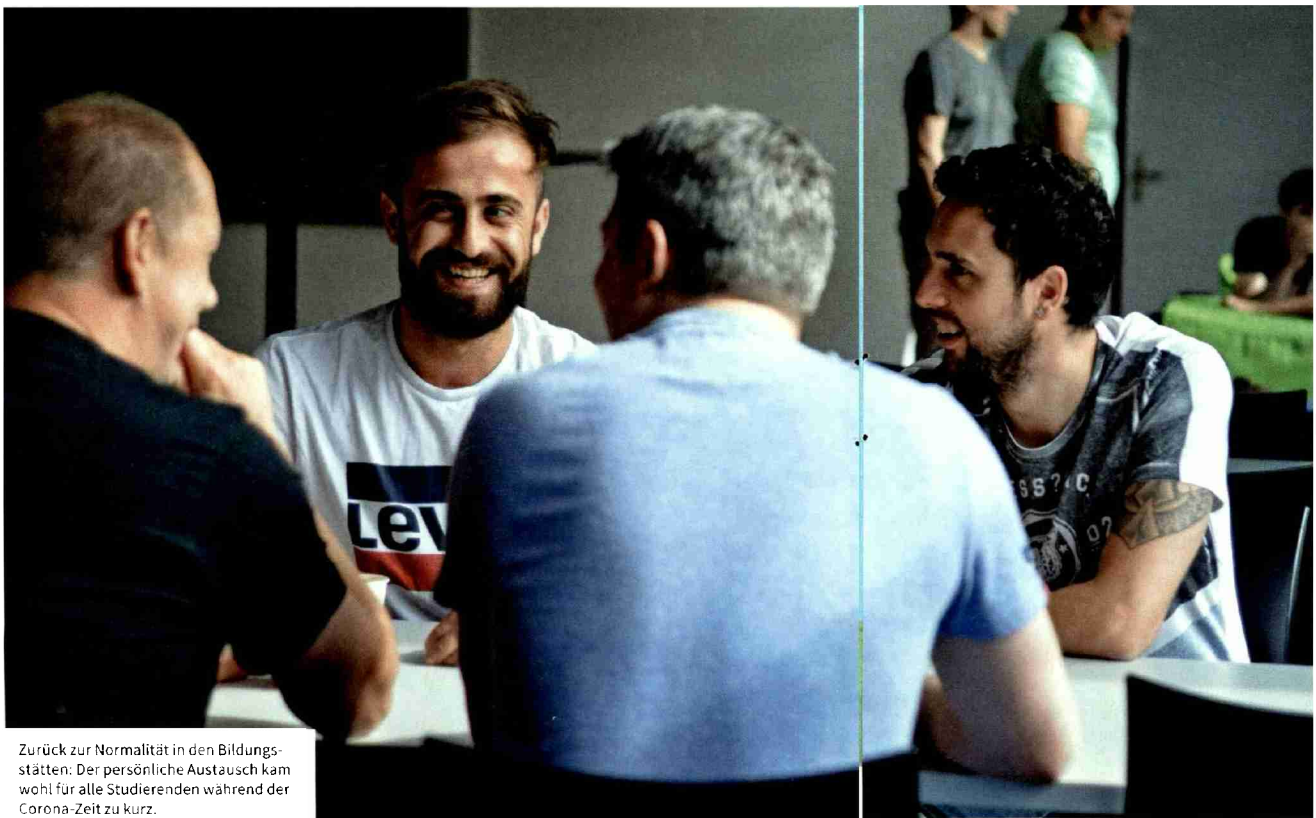
Zurück zur Normalität in den Bildungstätten: Der persönliche Austausch kam wohl für alle Studierenden während der Corona-Zeit zu kurz.