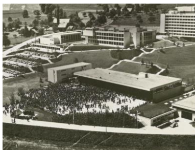
Eröffnung CAMPUS SURSEE 1972