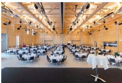
Eventhalle: Beispiel Bankett