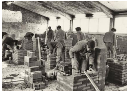
Maurerlehrrhallen Sursee 1972