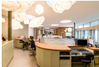
Réception und Foyer