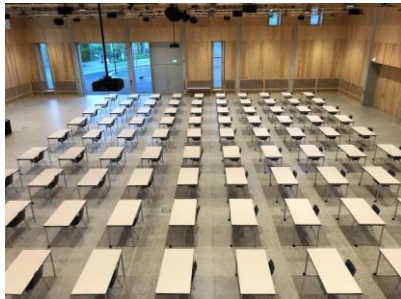
Eventhalle: Beispiel Prüfungsbestuhlung