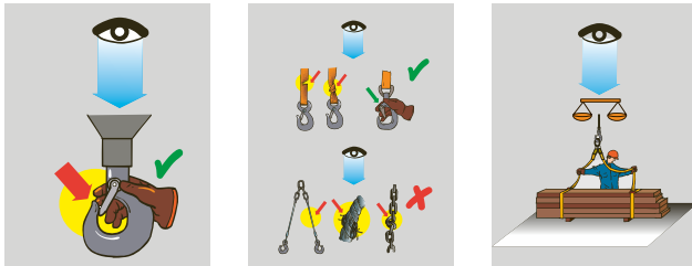
3 Lasten sicher anschlagen