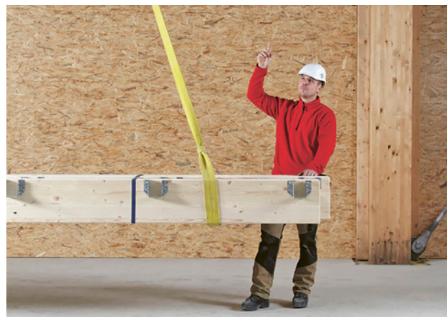
1 Die Ausbildung der Anschläger und Anschlägerinnen soll im gewohnten Arbeitsumfeld stattfinden.

Beim Anschlagens von Lasten ereignen sich immer wieder schwere Unfälle. Deshalb dürfen nur ausgebildete Personen Lasten anschlagen. Verantwortlich für die Auswahl und Ausbildung dieser Personen sind die Arbeitgeber.