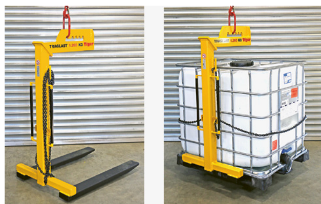
2 Die Ausbildung soll mit Anschlag- und Lastaufnahmemitteln durchgeführt werden, die auch im Arbeitsalltag zum Einsatz kommen.