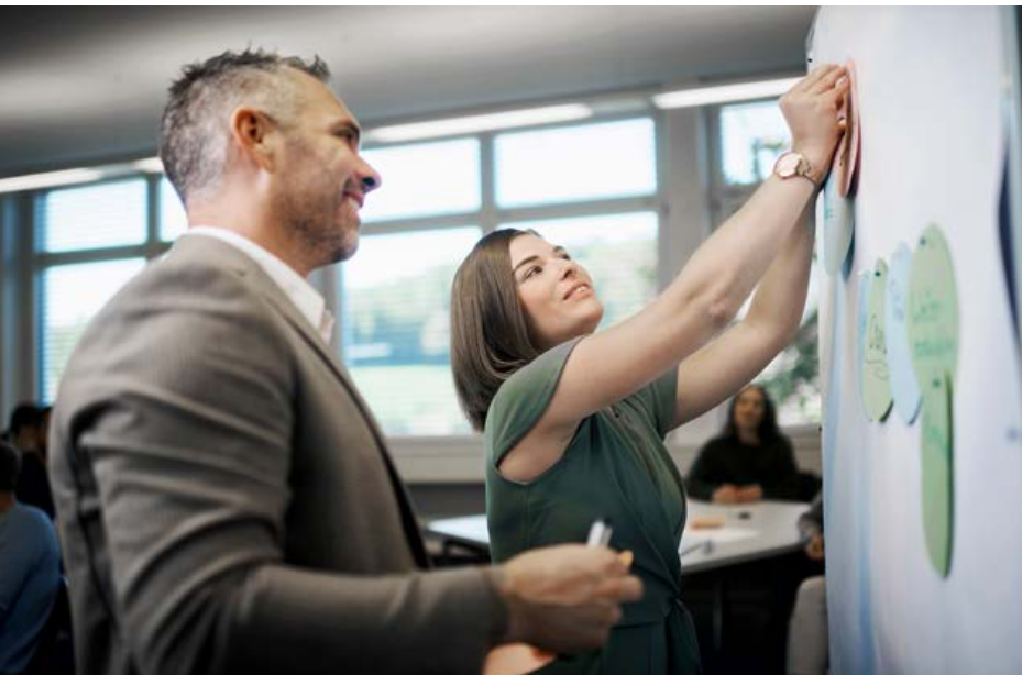
Die Schulungen sind exakt auf die Bedürfnisse des Auftraggebers zugeschnitten.

«Für dich nach Mass» steht für individuelle Weiterbildungen, exakt auf die Bedürfnisse von Unternehmen, Sektionen oder Regionen zugeschnitten – praxisnah, flexibel und wirkungsvoll. Stets im Vordergrund: der Kundenwunsch.