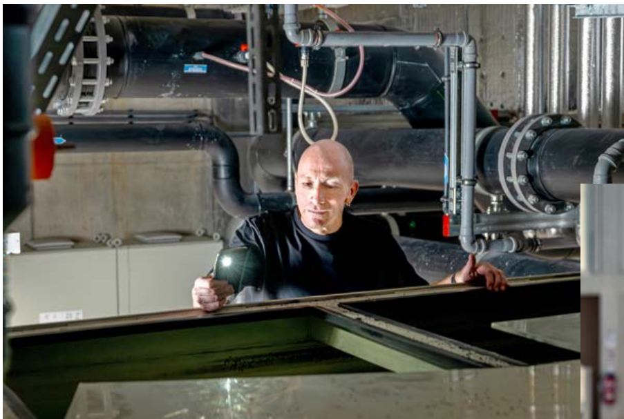
Ein Blick in die Tanks gehört zur Kontrolle dazu.