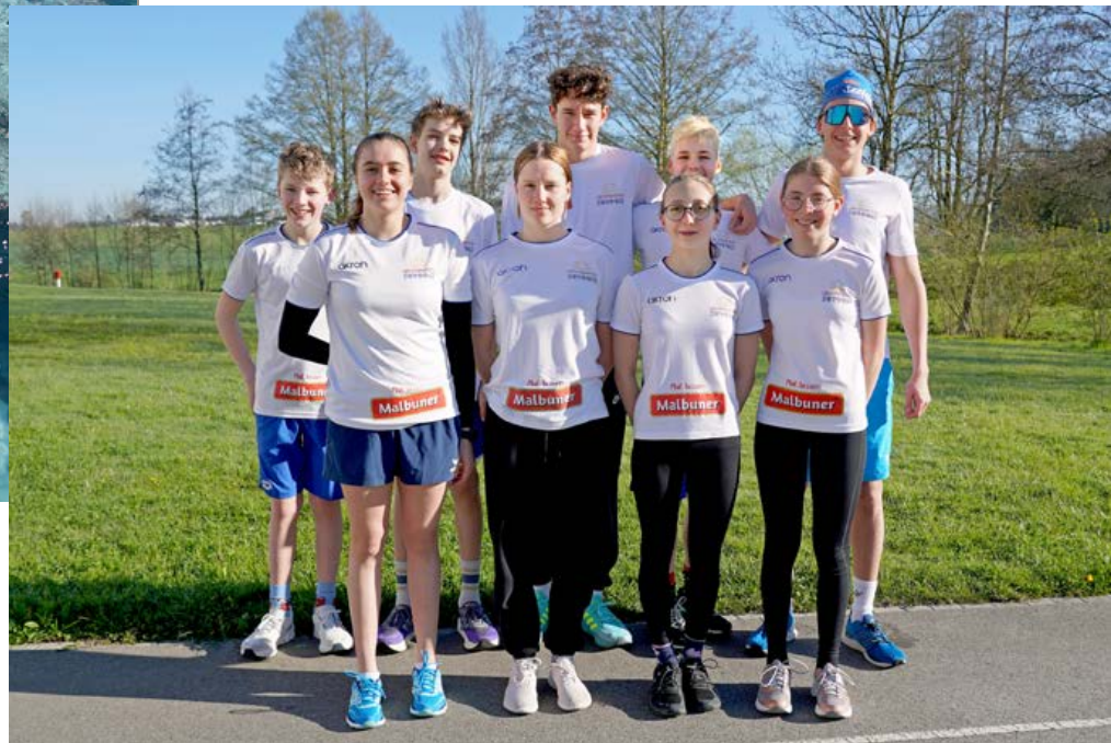
Lichtenstein Swimming schätzt die ruhige, entspannte Atmosphäre am Campus.