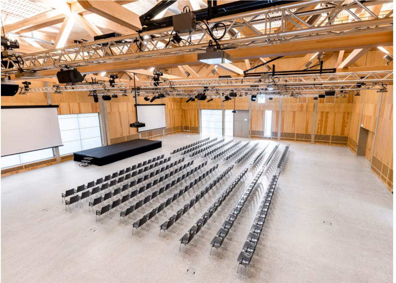
Die Grundlage nachhaltiger Veranstaltungen: durchdachte Architektur und flexible Nutzung