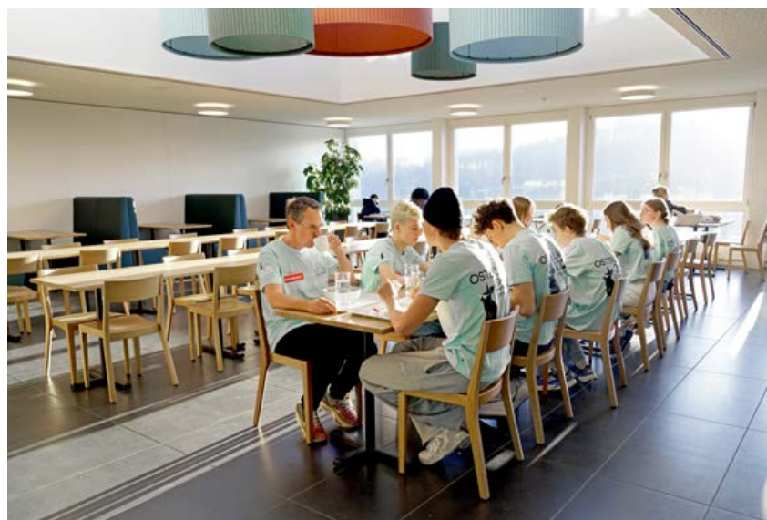
Gegen 7:30 Uhr ist Zeit für ein gemütliches Frühstück im MERCATO.

dynamischen Prozess, der sich aus immer neuen Reizen entwickelt und auf den Erkenntnissen der vorhergehenden Einheiten aufbaut. Es gibt zwar einen groben Rahmen mit klassischen Einheiten, dieser lässt jedoch genügend Spielraum für Anpassungen und berücksichtigt den aktuellen Zustand der Gruppe.