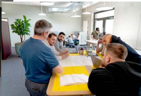
Verschiedene Lernorte bringen Abwechslung in den Alltag.

Unterstützt das Gebäude das Lernen und die Zusammenarbeit?