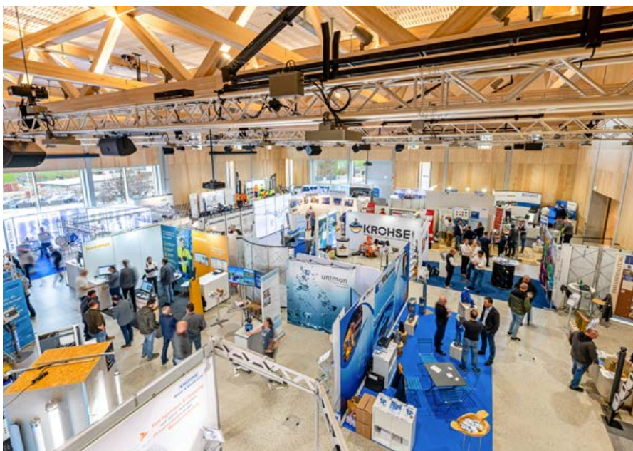
Raum für Begegnung, Wissen und Netzwerk: die Eventhalle im Messebetrieb