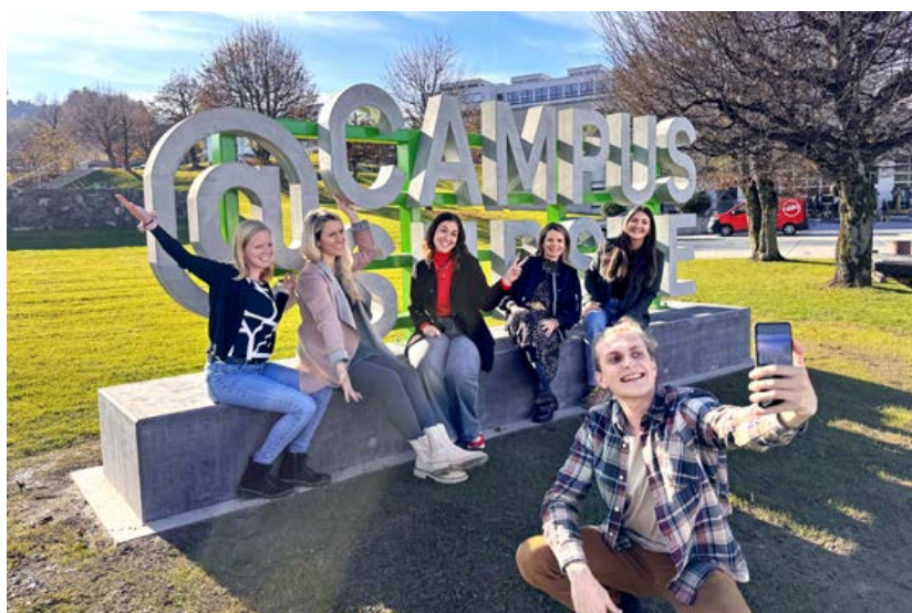
Die 13 individuell gefertigten Betonbuchstaben mit je rund 80 Kilogramm Gewicht bilden den neuen Selfie-Spot vor dem CAMPUS SURSEE.