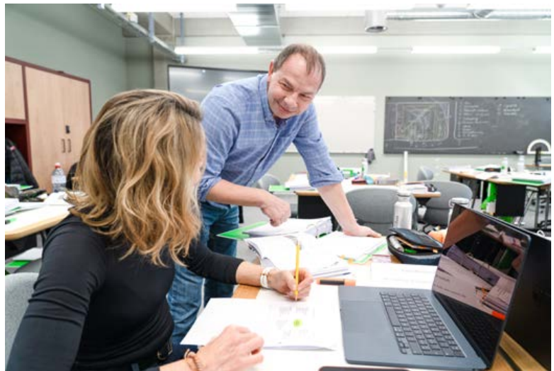
Moderne und helle Schulungsräume im Gebäude 1