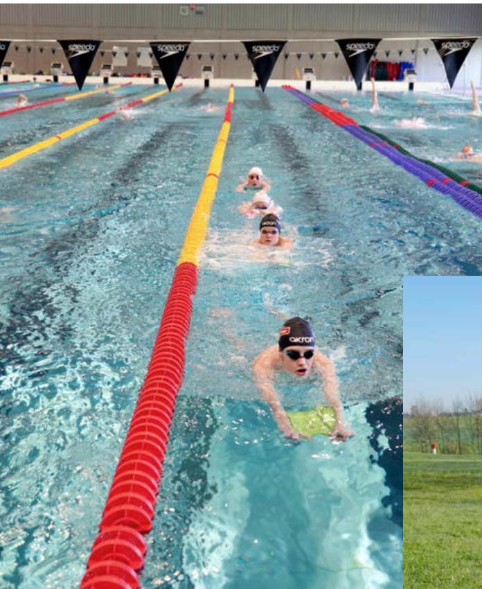
Das Team absolviert täglich zwei Schwimmeinheiten.