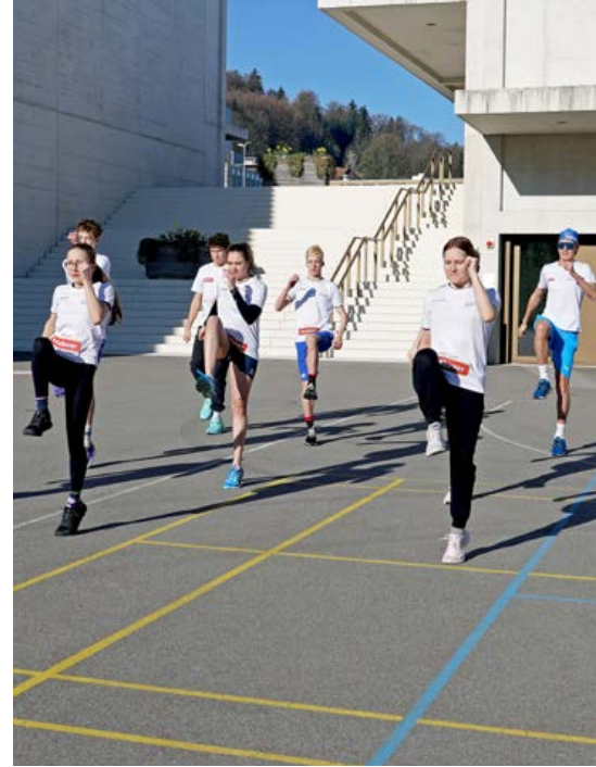
Neben dem Schwimmen finden als Ausgleich Übungen zur besseren Koordination und Ballspiele im Freien statt.