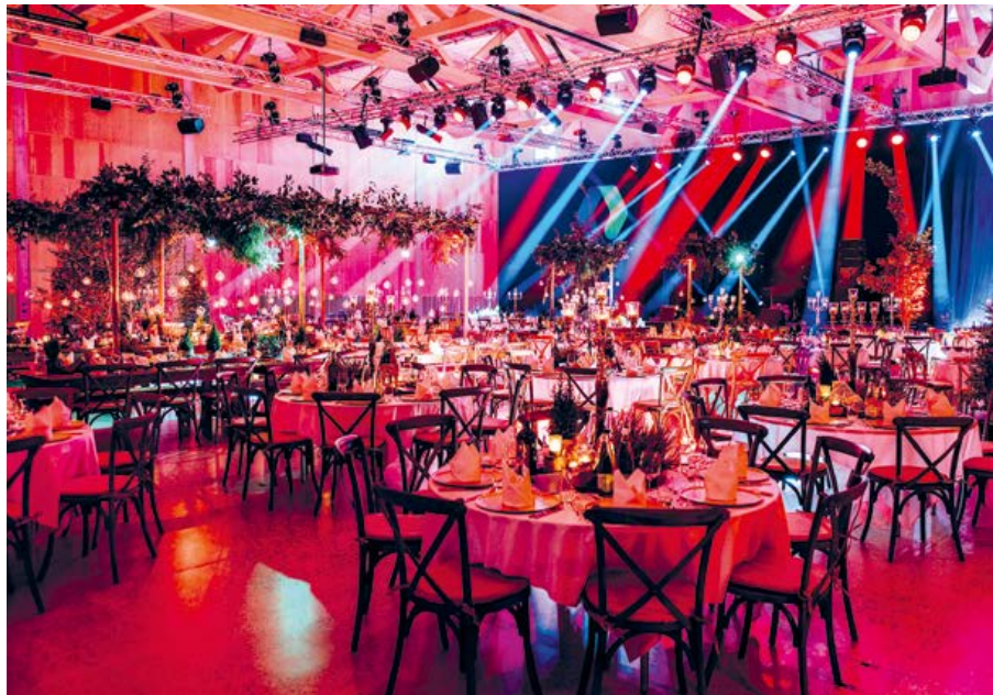
Wenn Raum zur Bühne wird: die Eventhalle am CAMPUS SURSEE in voller Inszenierung

Für Aussenstehende wird die Nachhaltigkeit insbesondere in der Gastronomie sichtbar. Zur Auswahl stehen Menüs, die auf saisonalen und regionalen Produkten basieren, möglichst aus biologischer Produktion stammen und mit kurzen Transportwegen angeliefert werden.