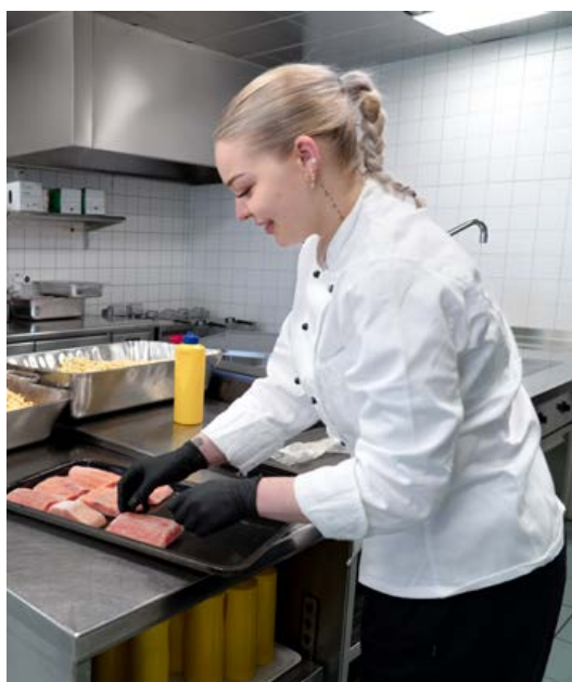
Für das Tagesmenü: Lachstranchen werden sorgfältig vorbereitet.