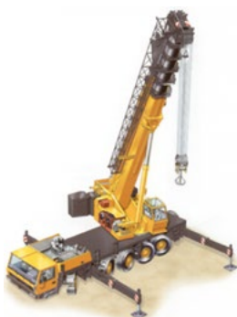
autogrù, gru gommata

Offerte supplementari (approfondisce le competenze richieste)