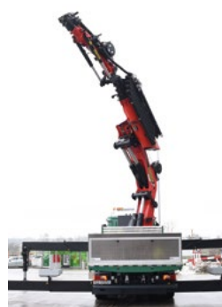
Lastwagen mit Ladekran (> 40 mt oder > 22 m Ausladung)